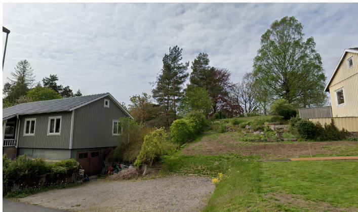
Vy från Prästerydsvägen, Befintligt, bildkälla: Google.com