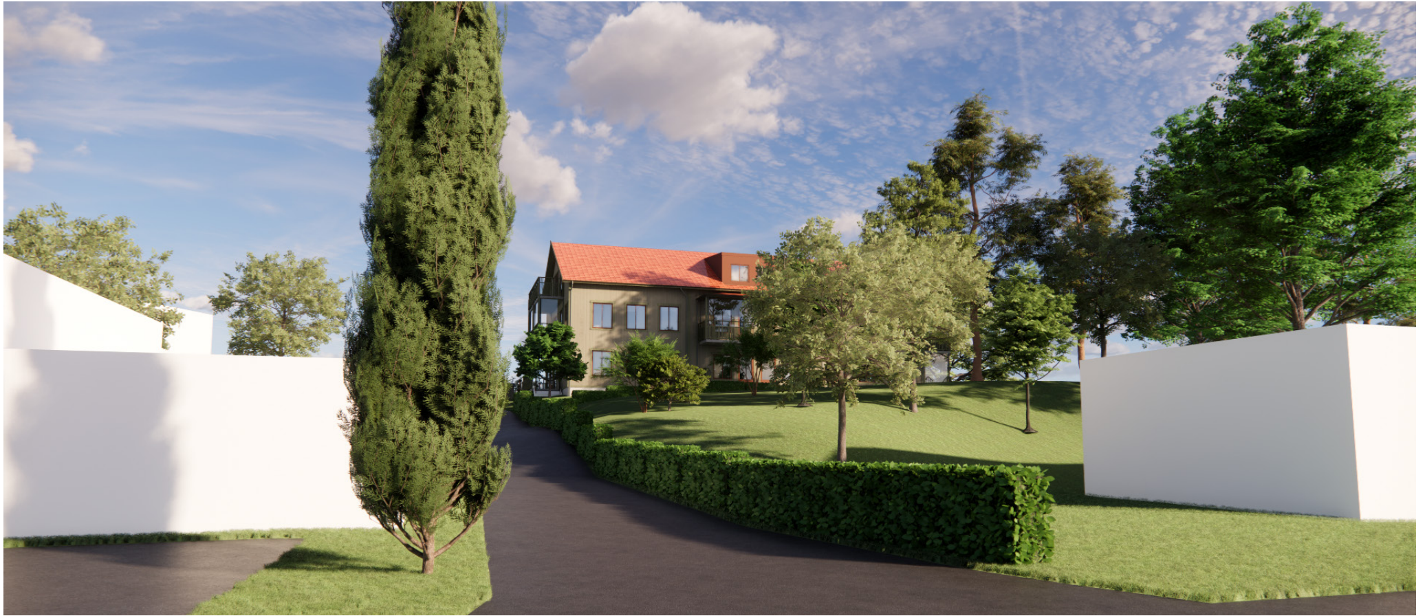
Vy från infarten vid Prästerydsvägen