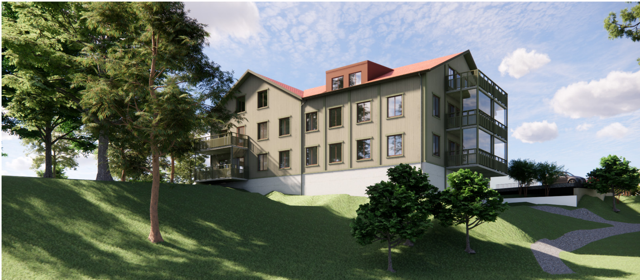
Vy från bäckravinen.