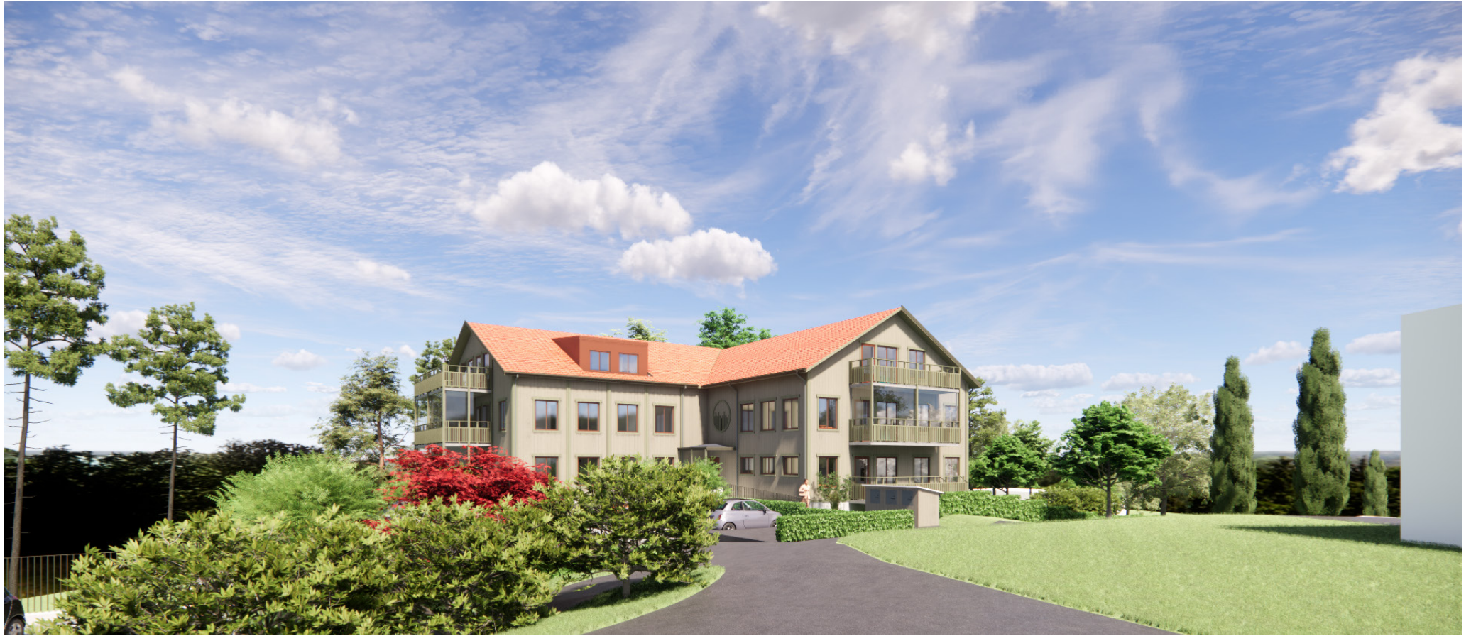
Vy från grannhuset i sydväst.