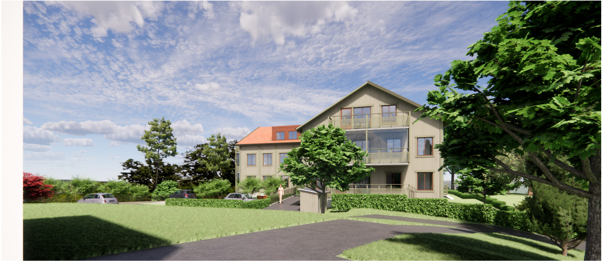
Vy från grannhuset i söder.