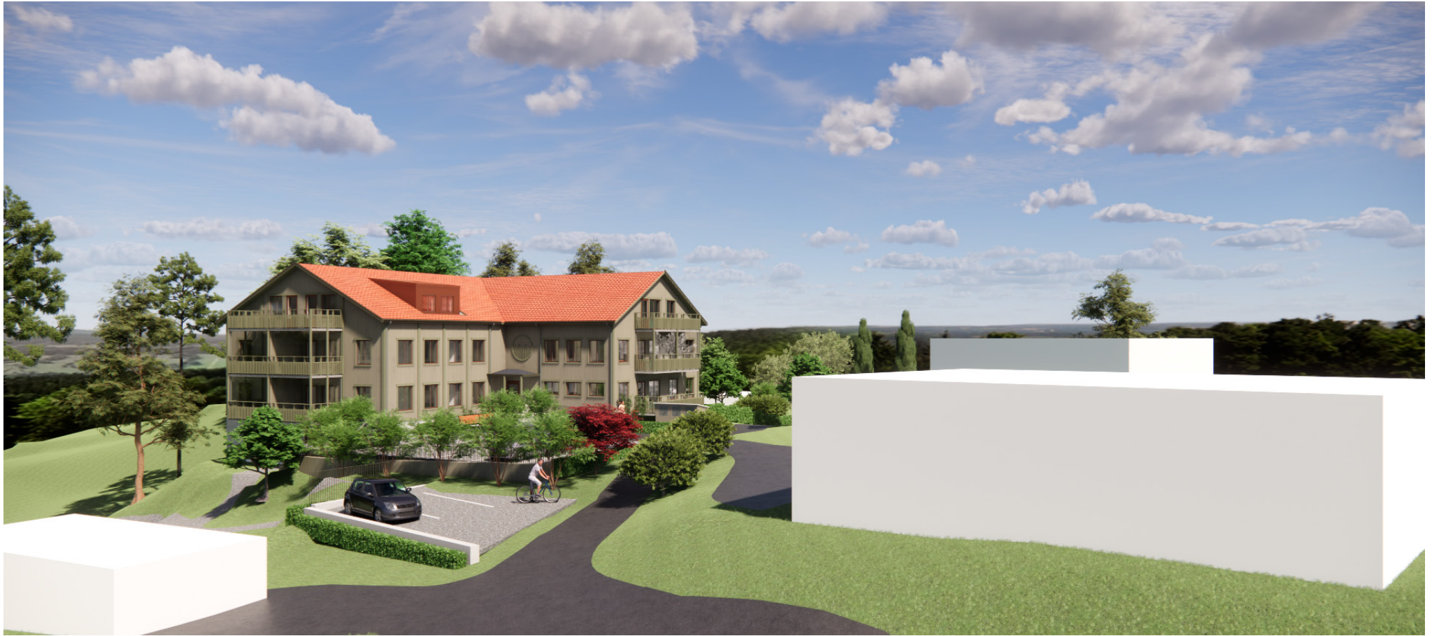
Vy från Sydväst.