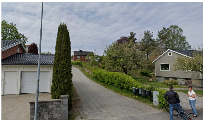
Vy från infarten vid Prästerydsvägen, Befintligt